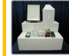
後飾り祭壇・仏具